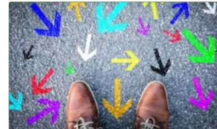
Inklusive Berufliche Orientierung